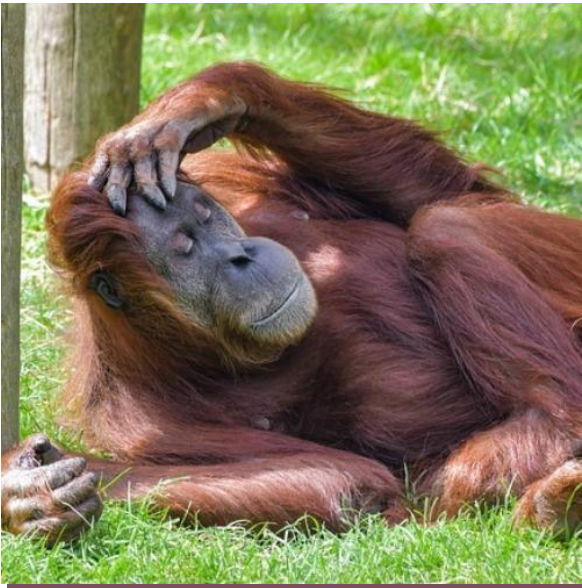
Orangutana Sandra, Argentina

Investiga sobre las historias de estos animales