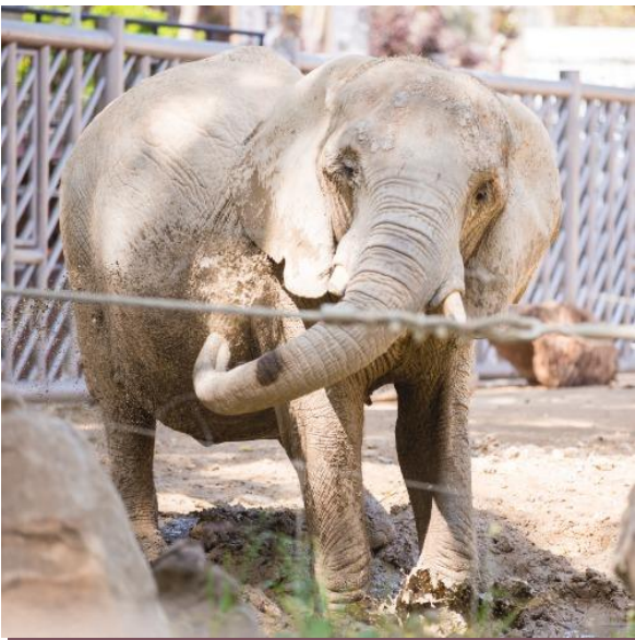
Elefanta Susi, España