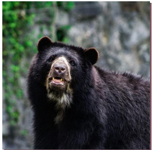
Oso Chucho, Colombia